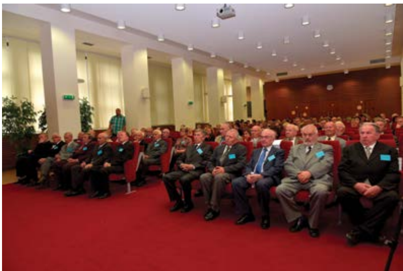
Jubilanti a jejich rodinní příslušníci

okresní veterinární zařízení do pozice obvodního veterinárního lékaře nebo na místa veterinárních lékařů veterinárních hygienických středisek a laboratoří. Veterinární péče byla zaměřena na potravinová zvířata a charakter činnosti veterinárního lékaře vyžadoval často specializační vzdělávání. Řada z nich také úspěšně vykonala atestační zkoušky. Nebyla to ovšem jen profesní nutnost, ale touha dále se vzdělávat. S privatizací veterinární služby mnozí pokračovali jako soukromí veterinární lékaři, ale s nutností přeorientovat se na výkon veterinární činnosti se zaměřením na malá zvířata. Pro některé byla místem profesní realizace i oblast školství a výzkumu. Jednotlivci vystoupali až do manažerských pozic, jiní našli dobré profesní uplatnění v zahraničí. Nikdo z jubilantů se neuzavíral jen do prostředí veterinární medicíny, o čemž vypovídá pestrá paleta zájmů, včetně různých společenských aktivit v místech bydliště. Potom zazněla jména dalších třiceti absolventů, kteří se z vážných důvodů nemohli „zlaté“ promoce zúčastnit a jimž byly diplomy zaslány poštou. Na počest promovaných zazněly tóny Gaudeamus igitur .