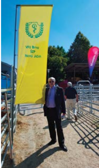
Prezentace VFU Brno ŠZP Nový Jičín

Bezpečná adjuvans a liposomální nosiče pro konstrukci rekombinantních vakcín