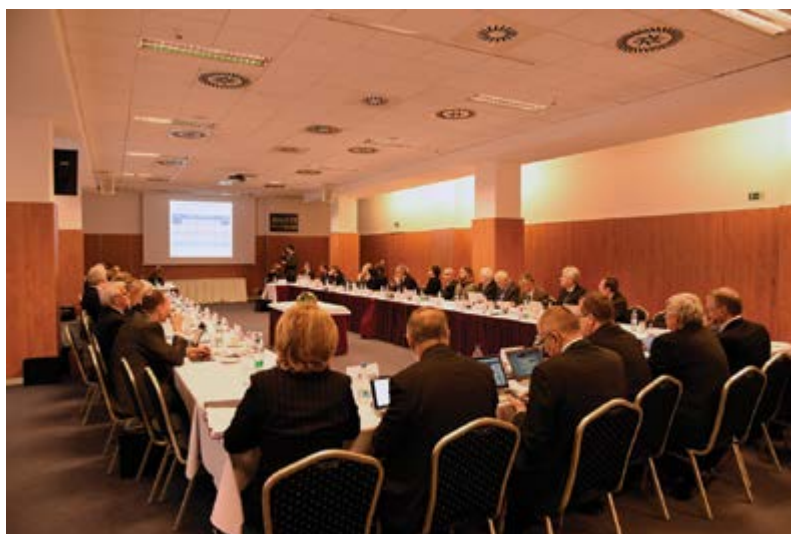
Účastníci ocenili precizní přípravu i průběh jednání

Česká konference rektorů je řádným kolektivním členem Evropské univer-