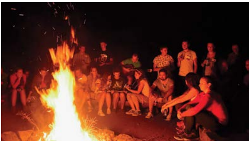
Večere a pohoda u ohně

lubydličího, který má klíče) byla: „Stag padá“. O tomto fenoménu jsme se měli záhy přesvědčit na přihlašování nepovinných předmětů sami. Týmy byly rozčleněny podle zvířat na Býky, Kozy, Ovce, Pštrosy, ale i Včeličky a mnoho dalších. Následující program byl poklidný, ani jsme se nenadáli a nad námi padlo přitní. Rozdělal se oheň, masožravci si napíchlí špekáčky na klacíky a opékalo se. Přitom se nezapomnělo ani na vegetariány, či vegany, pro které bylo něco zdravě vypadajícího vždy po ruce. Atmosféra prvního dne byla dovršena u táboráku s kytarami a zpěvníky. Každý, kdo rád zpívá, i ten nejstydlivější, se přidal k ostatním a společně se notovalo.