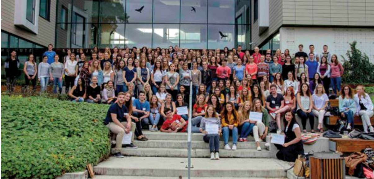
Studentská rodina farmaceutů se opět rozrostla