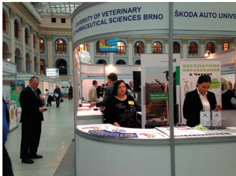
Projekt umožnil zástupcům VFU Brno oslovit potenciální uchazeče o studium v řadě zemí

Průzkumy QS World University Rankings ukazují, že například asijské