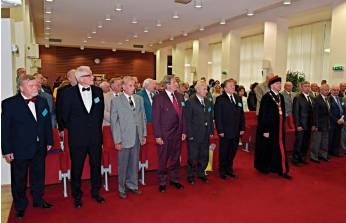
Příchod děkana FVL