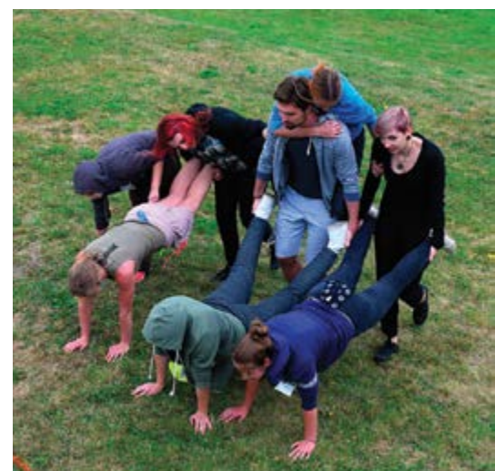
Některé soutěže byly bizarnější než ostatní

Pro hojnou účast zájemců se jelo do Protivanova ne jedním, ne dvěma, ale dokonce třemi autobusy. Společně s doprovodnými vozidly a později i s motorkou si člověk připadal jako