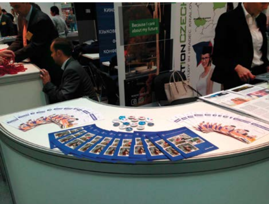
Odznaky s hravými motivy jsou oblíbeným propagačním předmětem

► Tytam jsou doby, kdy se na zahraniční studia vydávali spíše výjimeční jednotlivci. Tytam jsou i doby, kdy na českých školách studovalo jen pár zahraničních studentů. Studijní programy vyučované v anglickém jazyce už jsou na většině (českých) vysokých škol standardní nabídkou. Výjimkou není ani Veterinární a farmaceutická univerzita, která v posledních letech posiluje aktivity, jejichž záměrem je přivést do kampusu více zahraničních studentů. Vedle klasických studijních programů přijíždí na VFU účastníci výměnných pobytů a velké oblibě se těší i letní školy obou veterinárních fakult. Podpořit zahraniční propagaci a získat další zkušenosti na tomto poli nám letos umožnil i speciální projekt.