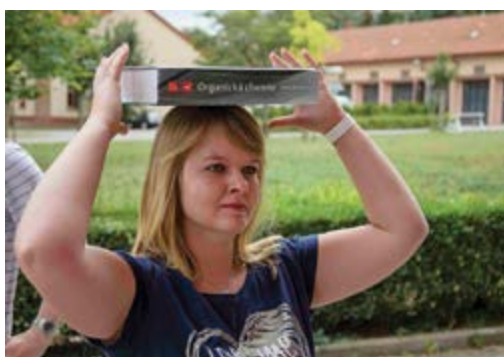
Balancování s tíhou organické chemie

Každý rok na naši univerzitu přijíždí desítky nových nezkušených studentů a já mám letos tu čest být mezi těmi, kteří se těšili dost na to, aby šli do školy (resp. jen do jejího areálu) ještě o dva dny dříve. Cílem bylo nejen poznat budoucí spolužáky, ale dozvědět se také tipy a triky, jak život na vysoké úspěšně začít a neskončit hned v prvním kole.