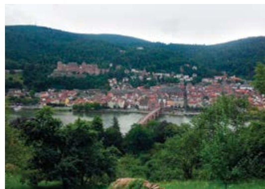
Kromě práce byl čas i na výlety a poznávání místní kultury

text: Petra Vodičková, 4. ročník FaF