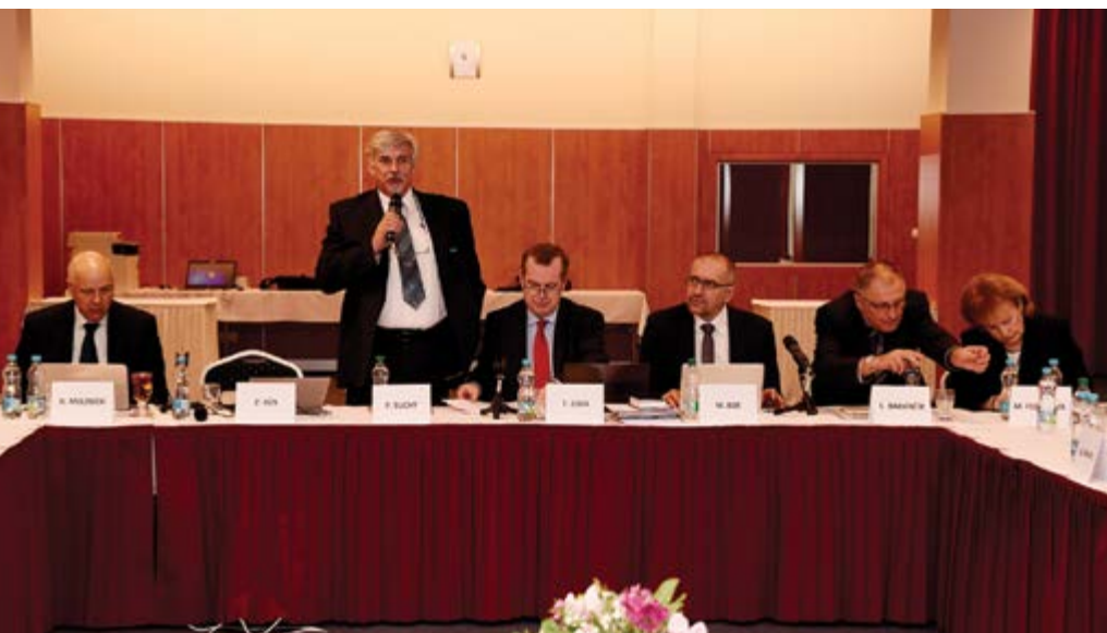
V péči VFU Brno se zasedání ČKR konalo potřeť

Za jednu z prestižních událostí roku 2016 v životě naší univerzity můžeme považovat konání České konference rektorů v péči Veterinární a farmaceutické univerzity Brno za účasti