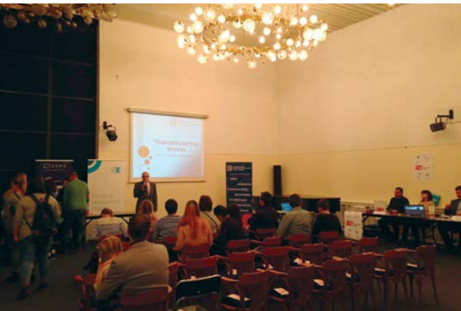
Kromě prezentace na stáncích je i na zahraničních veletrzích možné lákat zájemce o studium při speciálních přednáškách

Jako nováčka nás neustále sledovali organizátoři a alespoň jeden byl vždy „po ruce“, několikrát zasuploval i tlumočnicka. Po uzavření veletrhu nám dali několik doporučení pro případnou účast na dalších veletrzích, nabídli příležitosti pro prezentace v příštím roce a v případě zájmu i pomoc s přípravami v budoucnu. Dalšími desti-