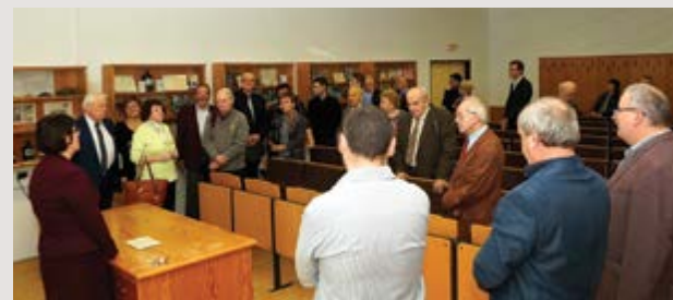
Seminární místnost v Pavilonu farmacie I oživila nová farmaceuticko-historická expozice

text: Tünde Ambrus