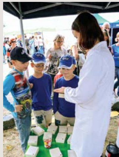
Děti u stánku VFU Brno zkoušely i poznávat přírodní drogy

text: Klára Krunková, 3. ročník FaF