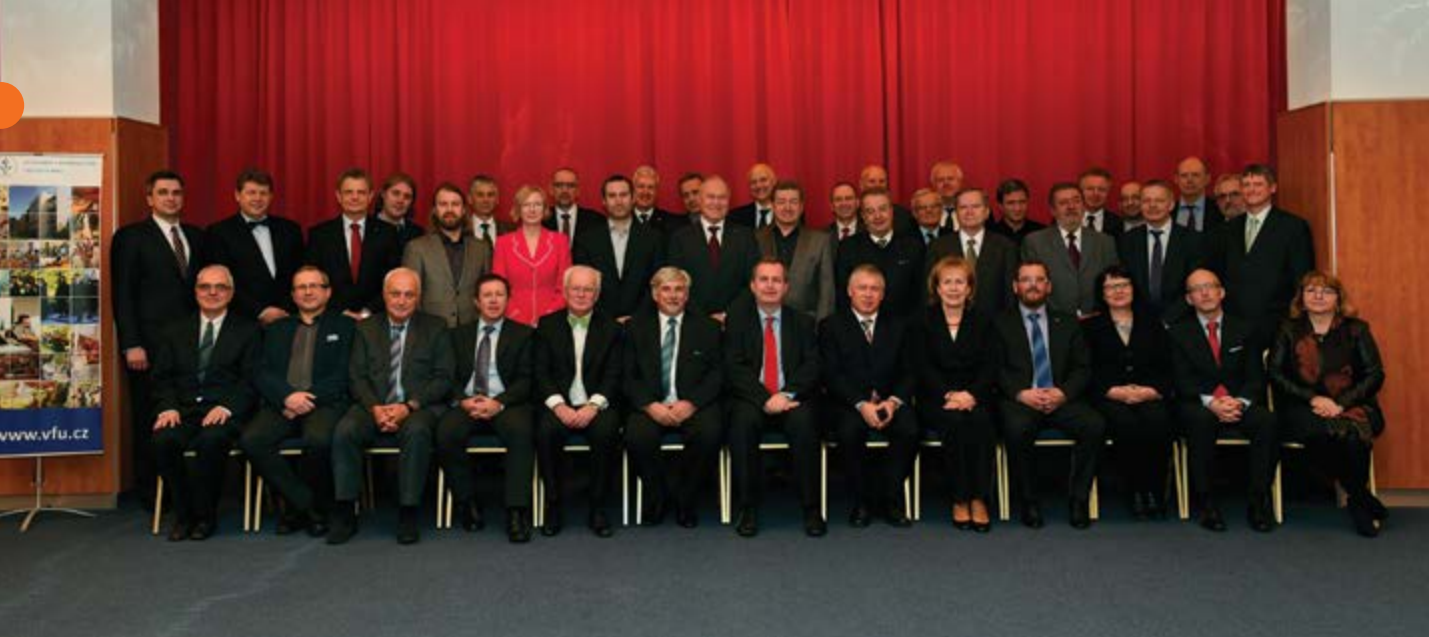
Účastníci 134. zasedání pléna České konference rektorů na společné fotografii