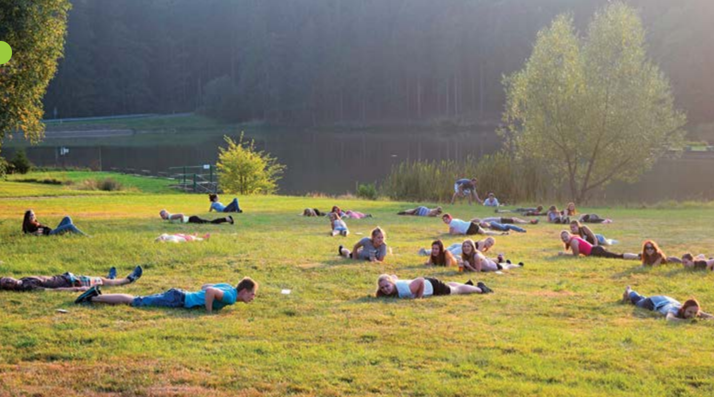
Pozor! Padá Stag.