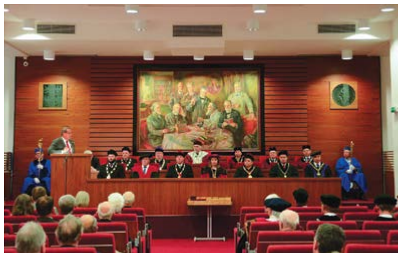
Projev prezidenta České lékárnické komory PharmDr. Lubomíra Chudoby