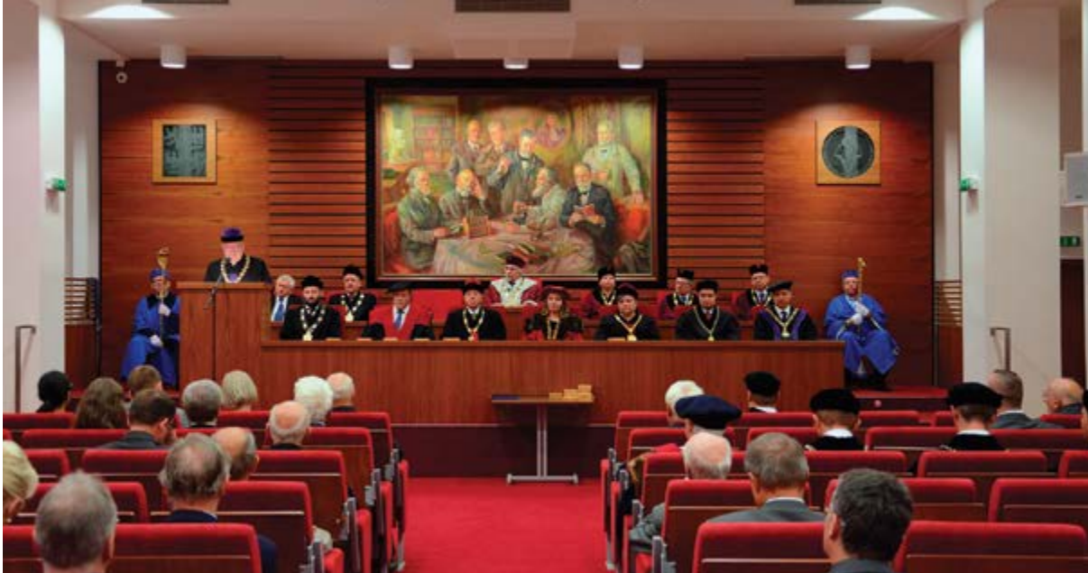
K výročí založení fakulty uspořádalo vedení FaF slavnostní zasedání Vědecké rady FaF VFU Brno v univerzitní Aule