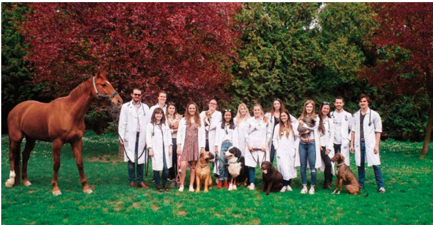
BVOIS board of 2016

support each other while reaching for the same goals, it makes it 100 times easier to do, (so thank you team if you are reading this)! Within BVOIS we also have an 8 week system, this means that we use the first 8 weeks of the semester to get everything planned and organised so that the most important weeks (credit weeks) are free to study.