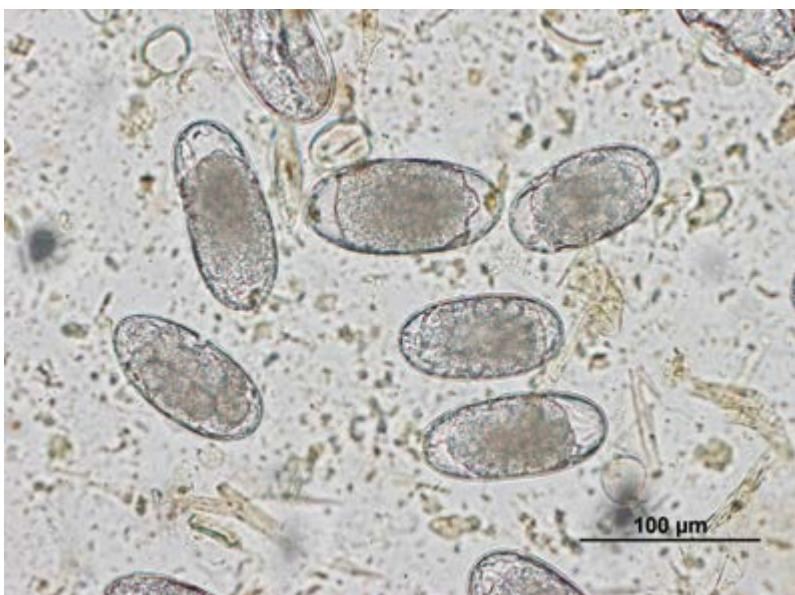
Vajíčka malých strongylidů při parazitologickém vyšetření trusu koně

text: prof. MVDr. Břetislav Koudela, CSc.